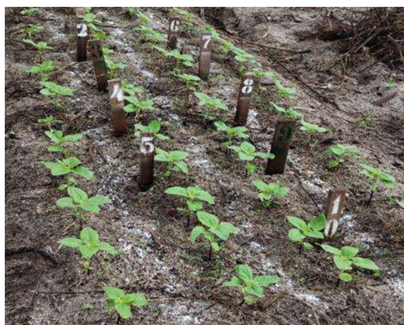
Figura 2 - Adubação de cobertura, 10 dias após o transplante.

Diariamente eram feitas duas irrigações nos horários mais frescos, antes das 8h da manhã e depois das 16h da tarde, o esterco adicionado no preparo do solo foi a adubação orgânica e de fundação, feita uma adubação de cobertura química com 75g de ureia e 75g de sulfato de potássio 10 dias após o transplante (figura 2).