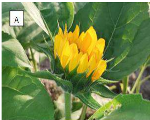
Figura 8 - Primeiro ponto de colheita, estágio R5 (A), segundo ponto de colheita, estágio R5.1 (B).

das mesmas, o que é fundamental para atender às expectativas dos consumidores e garantir o sucesso comercial das flores. Tomiozzo et al., 2024 relatam que a abertura floral continua e quando 50% das flores tubulares completaram ou estão em antese é o estágio R5 – metade das flores tubulares abertas e quando 100% estão abertas, é o estágio R5.1, caracterizando o final da abertura floral.