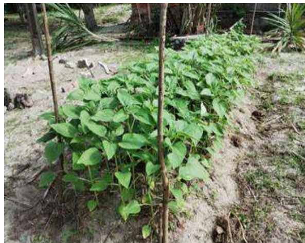
Figura 3- Tutoramento feito com estacas e fio de náilon.

Dentre as 100 plantas, 10 foram marcadas para serem avaliados os parâmetros morfológicos como: número de folhas, altura de planta e estágios da floração. O intervalo entre as avaliações foi de 8 dias, do dia do transplante até o dia da colheita. Para garantir a qualidade das hastes, foi realizado o tutoramento do canteiro que consistiu em cercá-lo com 4 estacas de mais ou menos 1 metro e meio e usar barbante entre elas, evitando que as plantas tombassem e causassem tortuosidades ou defeitos que compromettesse a beleza das flores, bem como seu desempenho (figura 3).