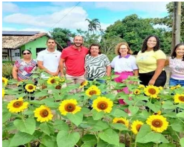
Figura 4 - Dia 22 de janeiro 2024, dia de colheita dos girassóis no sítio Batite –Jupi–PE.

pequenos agricultores e ser uma alternativa de diversificação de renda (figura 4).