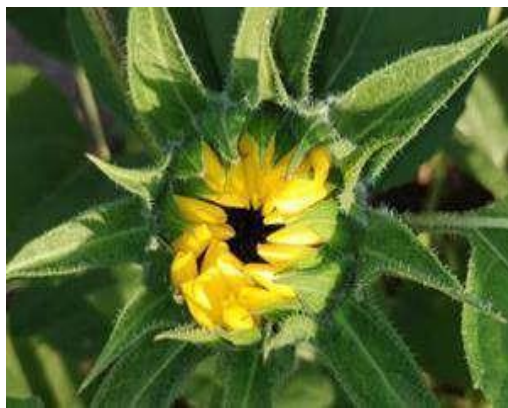
Figura 07 - Estágio R4 mostrando o amarelo intenso das flores liguladas.

com sua aparência e odor característicos. Foi observado em campo que esse estágio, assim como os seguintes (R5 e R5.1), tem uma duração curta de 48 horas (2 dias), um dado importante para o planejamento do agricultor em relação à durabilidade e qualidade das hastes florais para comercialização. Dados confirmados por Capellari (2010) que relata que o processo de antese das flores de girassol é relativamente rápido, durando entre 24 a 48 horas.