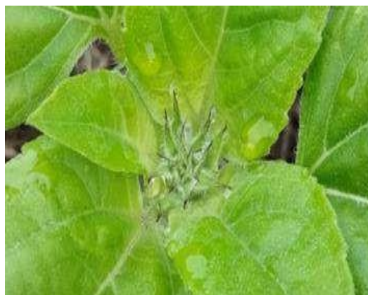
Figura 5 - Estágio R1, início da formação do botão floral.

O ciclo de vida do girassol começa com a germinação da semente. Quando a semente é colocada diretamente no solo, ou, em bandejas com substrato, úmido e adequado, ela absorve água e inicia o processo de crescimento, resultando na emergência de uma pequena plântula. Quando a planta apresentou 10 folhas (V10), aconteceu a transição do desenvolvimento vegetativo para o reprodutivo, nesta fase, o botão floral começou a se formar, indicando que a planta estava se preparando para a reprodução. No girassol o botão floral se desenvolve junto com a planta, o seu aparecimento marca o que chamamos de R1, que é o primeiro estágio da fase reprodutiva, onde os botões florais começam a se formar nas extremidades das hastes do girassol entre as folhas jovens e vai aumentando o seu perímetro gradativamente. Segundo Tomiozzo et al., 2024, o momento da ocorrência do estágio R1 pode variar entre 8 folhas (V8) e dezesseis folhas (V16). Os botões florais são pequenos e ainda estão fechados, mas em seu interior está ocorrendo o processo de desenvolvimento das flores, o final desse estágio é marcado pelo início da maturação das brácteas das flores tubulares (figura 5).